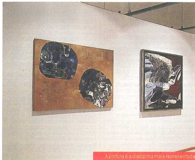
A pintura é a disciplina mais representada

A exposição está na Sociedade Nacional de Belas-Artes (Rua Barata Salgueiro, 36) até 29 de Agosto. Seg-Sex 10.00 - 19.00. Entrada gratuita.